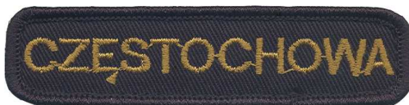
Wzór znaku identyfikacyjnego miejscowości.