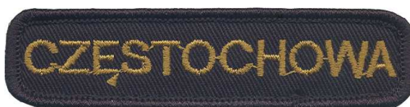
Wzór znaku identyfikacyjnego miejscowości.