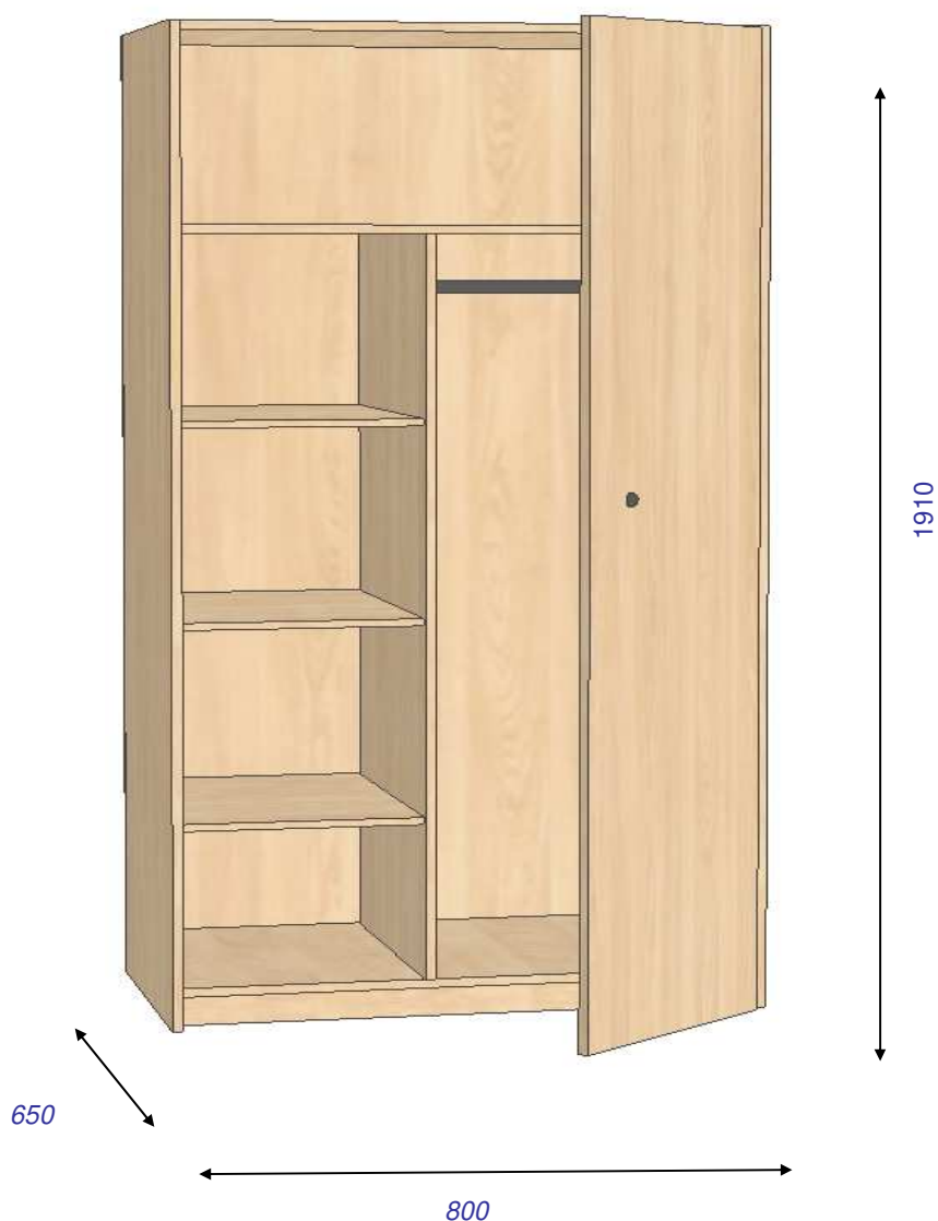
Fot. 1- Szafa ubraniowa zamknięta.

Rysunek nr 1- Szafa ubraniowa zamknięta.