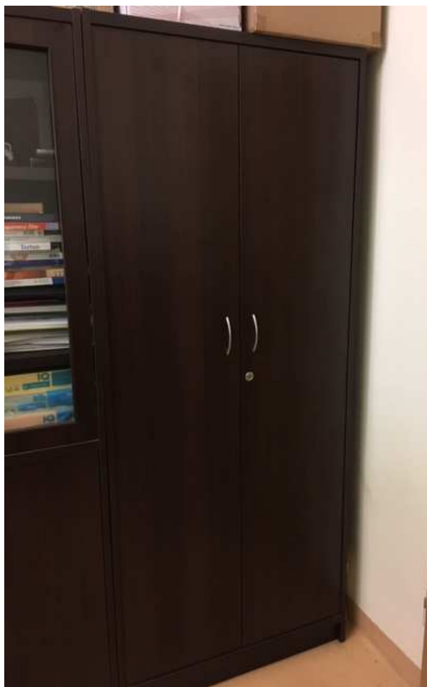
Fot. 2- Szafa ubraniowa zamknięta - uchwyty.